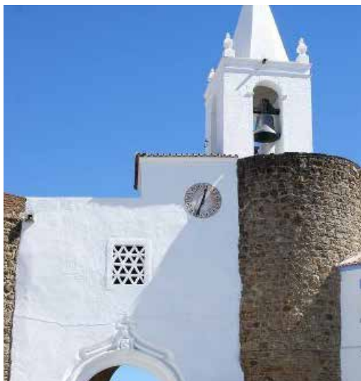
Centro Histórico de Redondo

Realizaram-se, no dia 18 de março de 2019, a terceira reunião da Comissão de Acompanhamento do Plano Operacional de Turismo (POT) de Redondo e o terceiro, e último, Seminário público de apresentação e discussão do Plano.