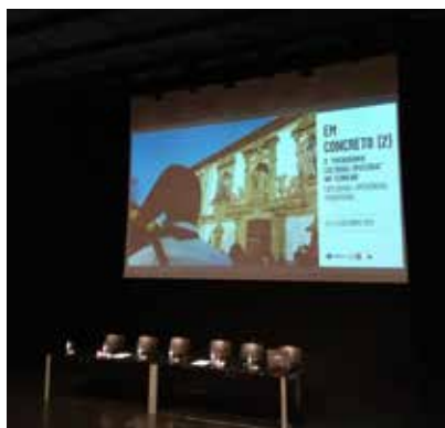
Auditório do CIAJG, Guimarães

A segunda edição do “Em Concreto”, organizado pela Oficina e pelo Centro em Rede de Investigação em Antropologia da Universidade do Minho, em colaboração com o Instituto de Etnomusicologia – Centro de Estudos em Música e Dança, realizou-se em 13-14 de dezembro de 2018 e pretendeu debater a noção de património cultural imaterial (PCI), instituída há pouco mais de uma década. O conceito tem suscitado grande atenção por parte da sociedade portuguesa, envolvendo investigadores, municípios, instituições culturais e comunidades locais.