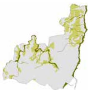
Proposta de Estrutura Ecológica de Matosinhos

A Câmara Municipal de Matosinhos está a proceder à Revisão do Plano Diretor Municipal (PDM) e a Quaternaire Portugal encontra-se, neste contexto, a colaborar com a equipa técnica municipal em duas componentes distintas. A primeira componente diz respeito à estrutura ecológica municipal, ao ordenamento solo rústico e à delimitação da Reserva Ecológica Nacional (REN) e da Reserva Agrícola Nacional (RAN). Ao nível da estrutura ecológica municipal, o trabalho envolve a delimitação, regulamentação e articulação com restantes opções de ordenamento. Ao nível do modelo de ordenamento, a colaboração envolve a definição e delimitação das categorias do solo rústico e sua regulamentação. Por fim, ao nível da REN e da RAN, a Quaternaire Portugal delimitou das reservas “brutas” e desenvolveu as propostas de exclusões, assessorando o Município ao longo do processo de concertação com as entidades da tutela daquelas reservas.