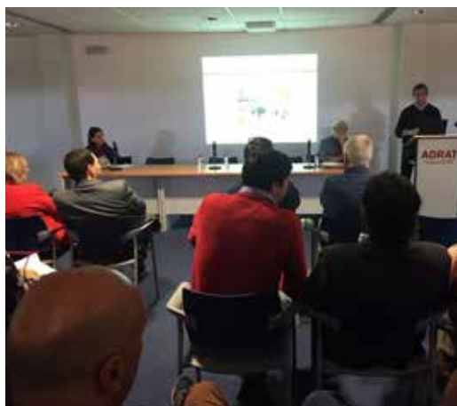
Sessão de trabalho coletivo em torno da estratégia de desenvolvimento local de base comunitária no Alto Tâmega.

O Desenvolvimento Local de Base Comunitária (DLBC) é um dos modelos de territorialização de políticas públicas previstos no Acordo de Parceria entre Portugal e a União Europeia para a aplicação dos Fundos Europeus Estruturais e de Investimento (FEEI) no período 2014-2020.