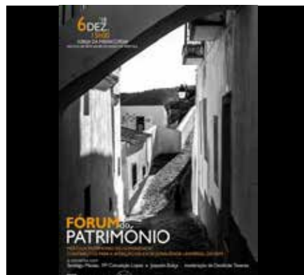
Cartaz da sessão “Mértola, Património da Humanidade? Contributos para a aferição da excepcionalidade universal do bem”

A primeira conversa aconteceu no passado dia 6 de Dezembro de 2018, tendo por tema “Mértola, Património da Humanidade? Contributos para a aferição da excepcionalidade universal do bem”. O imenso património acumulado e sempre acrescentado de conhecimento sobre Mértola deverá integrar a fundamentação da candidatura e o pretexto para um processo de reflexão, discussão e análise crítica participada e fundamentada de um ‘sítio de excelência na periferia’.