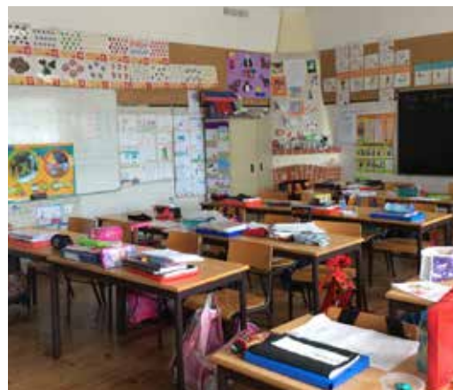
Sala de aula de um dos equipamentos públicos inseridos na rede escolar de Olião

A Quaternaire Portugal tem uma vasta experiência em estudos de diagnóstico do sistema de educação e formação e, concretamente, na elaboração de Cartas Educativas, tendo já realizado várias em diferentes regiões do país. Por outro lado, a sua experiência no domínio do ordenamento do território permite-lhe garantir a articulação deste instrumento com as opções de desenvolvimento urbano municipais e, deste modo, desenvolver de uma forma integrada um instrumento de planeamento que conjuga recursos físicos e com dinâmicas sociais.