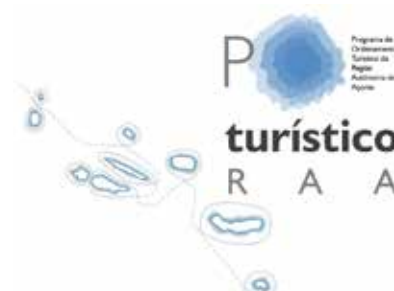
Logotipo do POTRAA

A Quaternaire Portugal , em consórcio com a Simbiente Açores, está a desenvolver a proposta de revisão do Programa de Ordenamento Turístico da Região Autónoma dos Açores (POTRAA), para a Direção Regional do Turismo dos Açores.