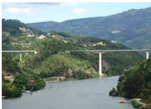
Ponte de Ermida

A Ponte da Ermida, que liga os concelhos de Baião, a norte, e Resende, a sul do rio Douro, foi inaugurada no ano de 1998, pretendendo fazer parte de um grande eixo rodoviário diagonal entre o interior (região de Viseu) e o litoral norte, ligando as autoestradas A4 e A11 com a A24. Embora grande parte deste eixo, a norte do Douro, tenha sido construído, ficou por executar o troço entre a ponte e a vila de Baião, onde se liga à rede viária principal.