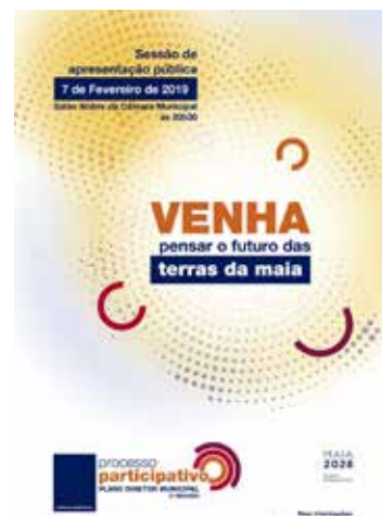
Cartaz da sessão de reflexão prospetiva realizada no âmbito da revisão do PDM da Maia

A intervenção versou sobre as grandes tendências da globalização e do desenvolvimento tecnológico que se colocam a uma economia como a portuguesa e a uma região fortemente extrovertida como o Norte. Entre os principais desafios abordados nesta intervenção, incluiu-se a questão da diminuição do produto potencial das economias (baixo crescimento) após a crise de 2007-2008, a interrogação sobre os efeitos do progresso tecnológico atual no crescimento económico e ainda a grande questão de saber por que razão o Norte é a região portuguesa com mais baixo produto per capita e produtividade do país.