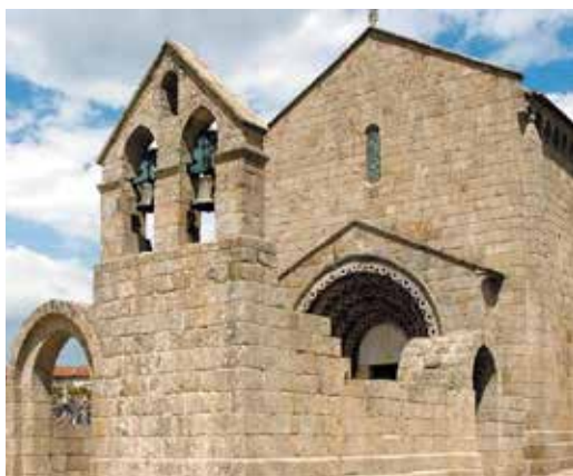
Mosteiro de Ferreira, Paços de Ferreira

A Quaternaire Portugal colabora, desde há longa data, com a Rota do Românico em diferentes projetos e iniciativas, designadamente na criação e implementação do sistema para a valorização de produtos e serviços turísticos da Rota, fazendo parte do seu Comité de Avaliação das candidaturas das entidades proponentes.