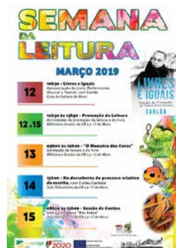
Cartaz de uma ação desenvolvida no âmbito do Plano Inovador de Combate ao Insucesso Escolar

Esta assessoria da Quatenaire Portugal , com uma duração de 6 meses, realiza-se em estreita articulação com o Município de Mora numa lógica de partilha de conhecimento, promovendo a sensibilização e capacitação para uma intervenção continuada da estrutura técnica municipal na promoção do sucesso educativo.