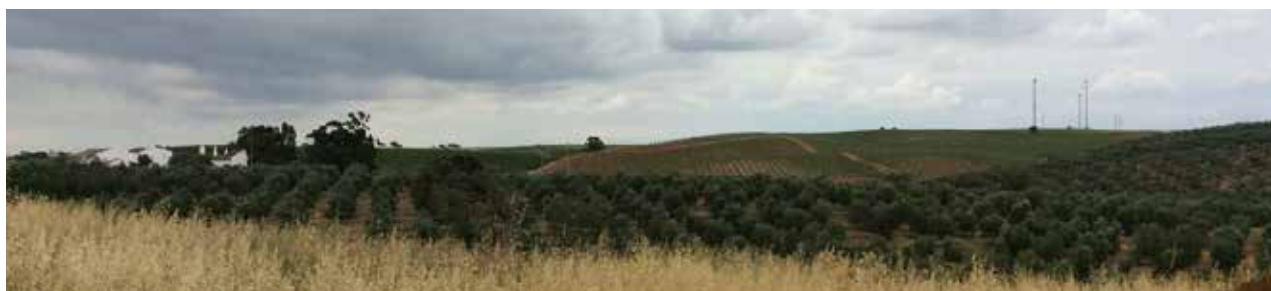
Herdade da Mingorra

Este é terceiro PIER que a Quaternaire Portugal desenvolve na região do Alentejo, estando ainda em curso a elaboração de um quarto plano.