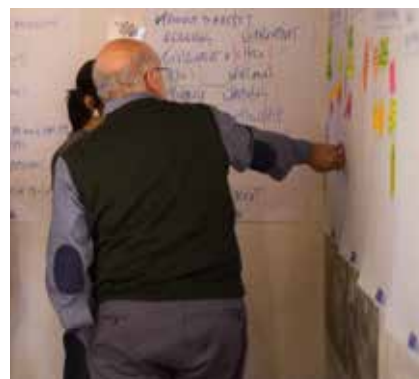
Imagem do encontro de peer review do Urban M realizado em Vilnius.