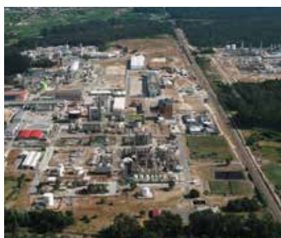
Complexo de Estarreja

A Associação Portuguesa de Química decidiu realizar um estudo que desenvolva estratégias e iniciativas para melhorar a relação de confiança entre as indústrias do setor localizadas nos complexos de Estarreja e de Sines e as comunidades envolventes - populações, entidades administrativas e sociais locais.