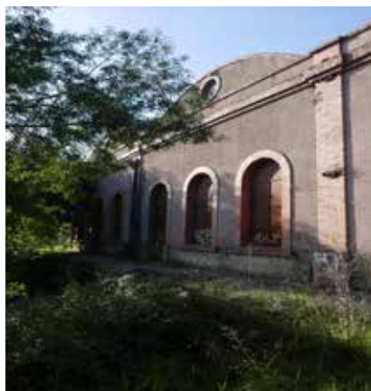
Central da Foz do Sousa

A Quaternaire Portugal desenvolveu um estudo de avaliação e proposta de reutilização da antiga Central da Foz do Sousa para a Águas do Douro e Paiva, S.A.. Trata-se de um espaço patrimonial, classificado como Imóvel de Interesse Público, cuja história está associada à génese do sistema de abastecimento de água ao Porto, encontrando-se hoje desocupado.