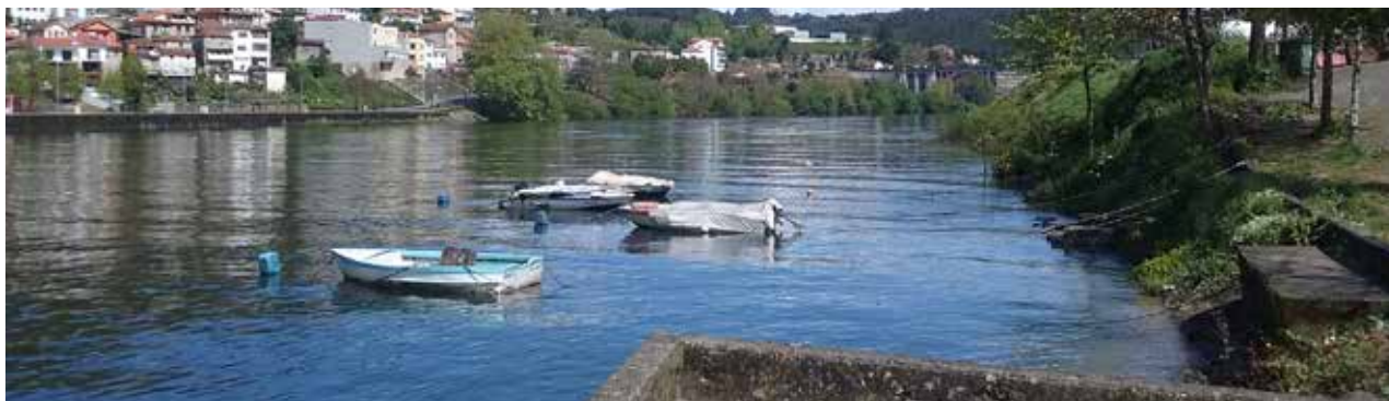
Ocupação urbana nas margens da albufeira

O Programa Especial da Albufeira de Crestuma-Lever (PEACL) iniciou-se em 2019 e a sua elaboração ocorre mais de uma década após a entrada em vigor do Plano de Ordenamento da mesma albufeira, igualmente desenvolvido pela Quaternaire Portugal . Trata-se, por um lado, que reconduzir um plano especial a programa especial, dando resposta à alteração do quadro legal operada em 2014/2015. O PEACL visa, ainda, a atualização das soluções adotadas no plano em face das novas dinâmicas socioeconómicas verificadas no território.