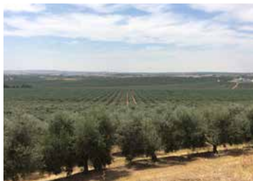
Perspetiva sobre o olival da Herdade

Pretende-se desenvolver uma solução que permita concentrar na Herdade da Fonte dos Frades as condições para transformação primária da produção do conjunto de explorações do grupo, mas também dos agricultores de proximidade.