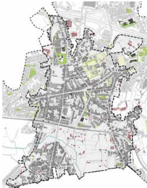
Delimitação da área de estudo

A cidade de São Mamede de Infesta assume-se, agora, como a prioridade para estender a dinâmica reabilitação a outros setores urbanos do concelho, fruto das diversas problemáticas que encerra, das dinâmicas que se começam a sentir e das oportunidades que a envolvente lhe proporciona, estando prevista a sua conclusão até ao final do presente ano.