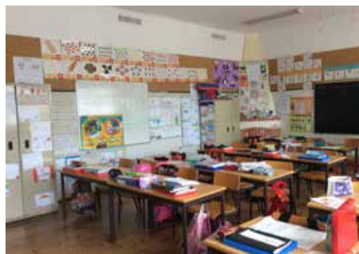
Sala de aula da rede escolar de Olhão

O Plano Estratégico Educativo Municipal (PEEM) de Olhão assume-se como instrumento de conhecimento e enquadramento da ação, do município e do sistema de atores, em matéria de educação, formação de jovens e adultos e promoção da aprendizagem ao longo da vida.