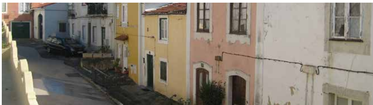
Edifício do centro histórico

Por outro lado, foram definidas medidas de qualificação do espaço público, de melhoria da mobilidade e de dinamização do tecido económico. A mudança de função de parte significativa da área de intervenção, afeta anteriormente ao Instituto de Odivelas, constituiu um dos desafios deste Plano. A sua discussão pública realizou-se entre Agosto e Setembro do presente ano, estando em curso a ponderação e a produção da versão final do Plano que será sujeita a aprovação da Assembleia Municipal de Odivelas.