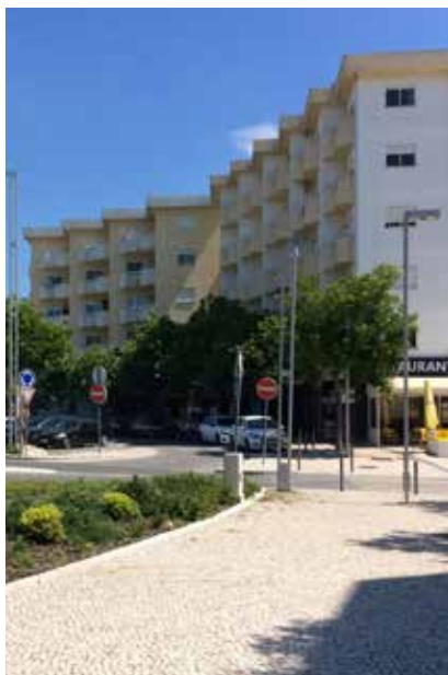
Paisagem urbana de Fátima

A Quaternaire Portugal iniciou em 2019 a segunda revisão do Plano de Urbanização de Fátima, um plano que orienta, desde 1995, o desenvolvimento de Fátima, cidade-santuário com elevado significado religioso e simbólico para o mundo católico.