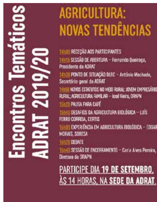
Poster de um dos eventos

Nesse sentido, a implementação do DLBC é acompanhada por um programa de animação, que integra atividades de divulgação, sessões de capacitação coletiva e de estímulo à geração de projetos alinhados com a estratégia.