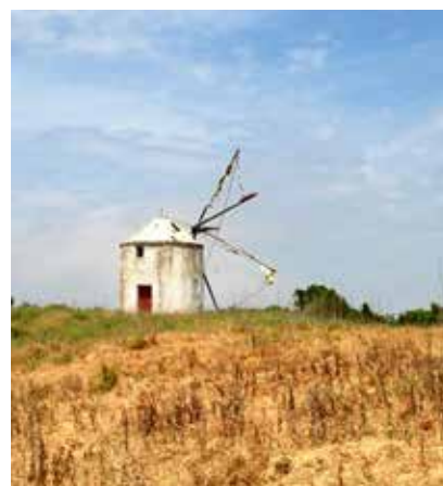
Paisagem do Planalto das Cesaredas

As novas rotas visam promover a visitação e a fruição dos valores naturais, históricos e culturais existentes, procurando aumentar a visibilidade do Planalto no contexto regional e melhorar a sua capacidade de atração de fluxos turísticos.