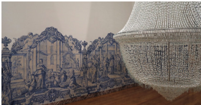
MACE – Museu de Arte Contemporânea de Elvas

visitantes e turistas, sem deixar de acautelar a integridade dos bens patrimoniais e os benefícios para as comunidades locais.