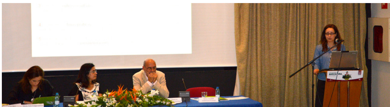
Seminário “Estratégias de Internacionalização da Fileira Agroalimentar”, realizado a 11 de junho de 2015 na Feira Agrícola de Santarém, onde foram apresentados o balanço e os resultados preliminares da avaliação externa realizada pela Quaternaire Portugal ao projeto “Sabores de Portugal”

O projeto “Sabores de Portugal”, cofinanciado pelo COMPETE – Programa Operacional Fatores de Competitividade do QREN – Quadro de Referência Estratégica Nacional e enquadrado nos Sistemas de Incentivos aos Investimentos das Empresas, em concreto no SI Qualificação PME – Sistema de Incentivos à Qualificação e Internacionalização de PME, foi a primeira experiência da Confederação dos Agricultores de Portugal no desenvolvimento de projetos conjuntos de participação de PME da fileira agroalimentar em exposições internacionais com vista ao apoio à sua internacionalização.