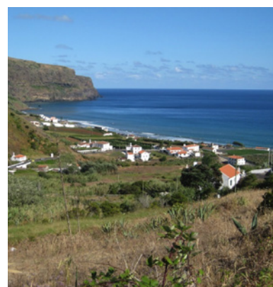
Praia Formosa (Ilha de Santa Maria)

Os Planos de Pormenor das Zonas Balneares dos Anjos e Praia Formosa, em Vila do Porto (Santa Maria, Açores) foram aprovados pela Assembleia Municipal, tendo sido publicados no passado dia 19 de outubro no Jornal Oficial da Região Autónoma dos Açores, ao fim de 4 anos de sessões de trabalho e discussão e elevada participação pública.