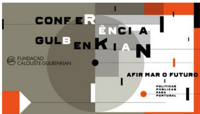
Imagem gráfica da Conferência e Publicação Afirmar o futuro: políticas públicas para Portugal

Foram recentemente publicadas, em dois volumes, as Atas da Conferência Afirmar o futuro: políticas públicas para Portugal , que decorreu na sede da Fundação Calouste Gulbenkian, em Lisboa, entre 6 e 7 de Outubro de 2014. Comissariada por Viriato Soromenho-Marques, e organizada pela Fundação Calouste Gulbenkian em parceria com o Institute of Public Policy Thomas Jefferson-Correia da Serra, esta conferência pretendeu suscitar uma reflexão crítica acerca do contexto atual e dos desafios que este coloca às políticas públicas, num momento de crise que o país e a Europa atravessam. Reunindo um amplo painel de especialistas (economistas, geógrafos, sociólogos, entre outros), oriundos na sua maioria do meio académico nacional, esta publicação reúne um conjunto de artigos que abordam um leque diversificado de temas relacionados com a formulação de políticas públicas na atualidade. Entre estes artigos, que consolidam as comunicações orais apresentadas publicamente, salientamos os contributos dos três Administradores Executivos da Quatenaire Portugal .