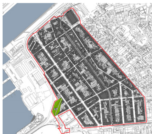
Limite das Áreas de Reabilitação Urbana de Matosinhos

No quadro das políticas urbanas, a Quaternaire Portugal mantém a sua aposta no domínio específico da reabilitação urbana, continuando a desenvolver os Programas Estratégicos de Reabilitação Urbana (PERU) para a ARU do Centro Urbano de Vila Nova de Famalicão (ARU entretanto publicada em sede de Diário da República ), para as ARU da Vila de Arouca, de Escariz-Fermado e de Alvarenga, ambas no concelho de Arouca (já publicadas em Diário da República ) e para as ARU de Matosinhos e de Leça da Palmeira (recentemente publicadas em Diário da República ).