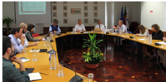
Sessão de reflexão com entidades locais sobre posicionamento institucional da AMAL, 28 de outubro de 2015

Na sequência da elaboração do Plano Intermunicipal de Alinhamento com a Estratégia Algarve 2014-2020 que a Quaternaire Portugal coordenou para a Associação de Municípios do Algarve – hoje Comunidade Intermunicipal do Algarve AMAL –, esta entidade solicitou à Quaternaire Portugal a formulação de uma estratégia de posicionamento.