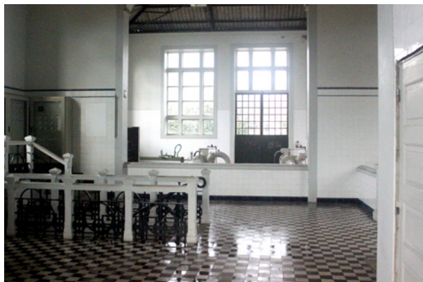
Central de Nova Sintra (Porto)

A Quatenaire Portugal desenvolveu, por encomenda do Atelier 15 – Arquitectos, Lda., o Estudo de Valorização de Bens Patrimoniais da Águas do Porto, EM. Esta empresa é herdeira e detentora de um conjunto de infraestruturas que constituem um património de significativo valor e interesse histórico-cultural, estando atualmente parte dele desafetado do seu funcionamento regular.