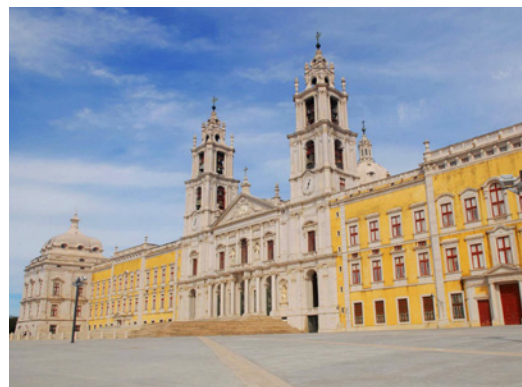
Palácio Nacional de Maфра

O Plano Estratégico para o Turismo de Maфра foi apresentado ao Conselho Municipal de Turismo no passado dia 4 de Novembro de 2015, assinalando a conclusão do estudo que procedeu à revisão do plano anterior, desenvolvido pela Quaternaire Portugal em 2007.