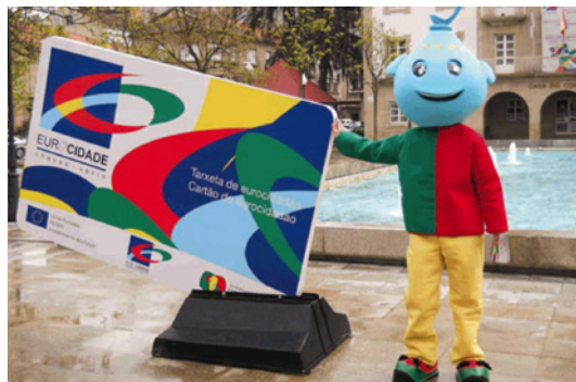
Ação de promoção da Eurocidade Chaves-Verín

A Eurocidade da Água é, hoje, uma realidade em plena consolidação, tendo a sua génese numa iniciativa dos dois Municípios e da Associação Eixo Atlântico, que foi plasmada na elaboração, em 2008, da respetiva Agenda Estratégica. A Quatenaire Portugal , que assegurou o apoio técnico a essa Agenda, integrando uma equipa transfronteiriça de consultoria, felicita os responsáveis técnicos e políticos que transformaram as propostas em realidade.