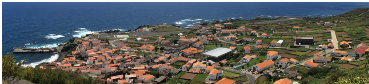
Vista panorâmica da ilha do Corvo

A Quaternaire Portugal colaborará com o Município da Lourinhã na ponderação do processo de discussão pública e na produção da versão final do Plano que se perspetiva ser aprovada em Assembleia Municipal até o final do presente ano. O PDM da Lourinhã é um dos primeiros PDM a ser revisto à luz do Plano Regional de Ordenamento do Território do Oeste e Vale do Tejo e, simultaneamente, à luz na nova Lei de Bases da Política de Solos, Ordenamento do Território e Urbanismo.