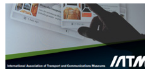
Pormenor da imagem gráfica da 40ª Conferência IATM (Porto, 2015).