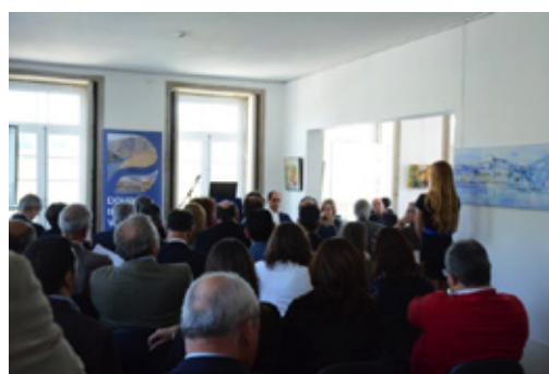
Douro's Inland Waterway: workshop sobre "política industrial e crescimento económico", em Gondomar