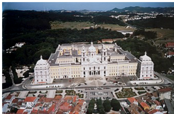
Palácio Nacional de Mafra

Foi também prestada uma assessoria ao Instituto Politécnico do Porto com vista ao estudo de Oportunidades de Financiamento no Domínio Cultural para a ESMAE.