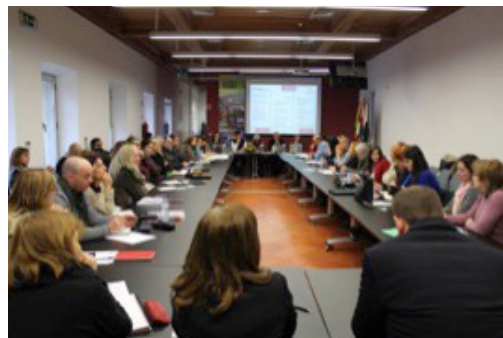
Sessão de discussão no Médio Tejo

Merece, igualmente, destaque a participação da Quaternaire Portugal no projeto Douro's Inland Waterway 2020 , promovido pela APDL, que assumiu recentemente novas competências na navegabilidade do Douro, em regime de partilha de responsabilidades com outras entidades com jurisdição no rio Douro.