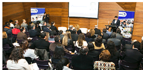
Evento anual do PO Capital Humano