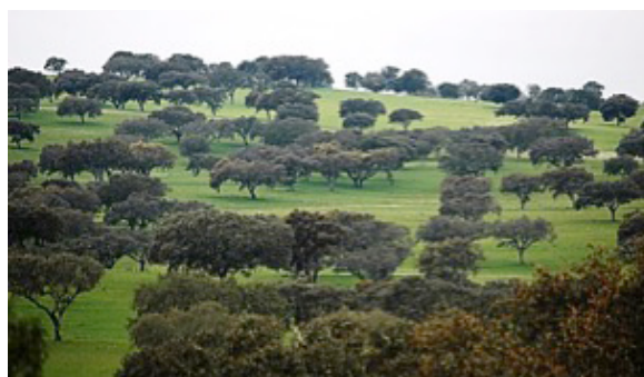
Paisagem de Montado Alentejano