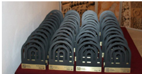
Selos de Qualidade da Rota do Românico