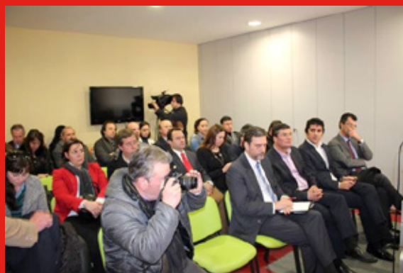
Sessão em Dão-Lafões

No ano de 2015, foram iniciados os módulos de aprofundamento regional, destinados a estabelecer processos pioneiros de concertação da oferta formativa de cursos profissionais ao nível das NUTS III, envolvendo as Comunidades Intermunicipais e Áreas Metropolitanas, Escolas Profissionais e Escolas com cursos profissionais, empregadores, municípios e outras instituições regionais e locais. A Quatenaire Portugal está a apoiar tecnicamente seis processos de concertação, em todo o país: no Alto Tâmega, em Trás-os-Montes, no Cávado, em Dão-Lafões, no Médio Tejo e na Área Metropolitana de Lisboa. Em alguns destes processos, o aprofundamento regional da antecipação de necessidades de qualificações foi acompanhado de trabalhos na área do combate ao insucesso escolar (Alto Tâmega) e de elaboração de Pactos para a Empregabilidade (Cávado).