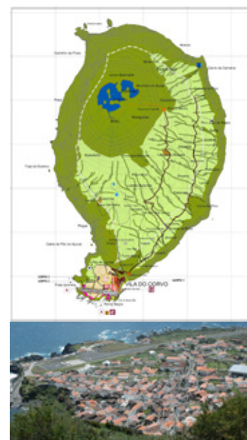
PDM do Corvo

Estão, neste caso, a publicação da legislação que “regula o processo de elaboração e implementação dos planos de ordenamento da orla costeira e do mar adjacente” (Decreto-lei n.º 14/2016, de 1 de março, BO da República de Cabo Verde), a aprovação da Estratégia Nacional para o Mar de Cabo Verde, que aguarda publicação, e a aprovação, em reunião conselho de ministro da República Democrática de Timor-Leste, de 20 de abril, da respetiva Lei de Bases do Ordenamento do Território.