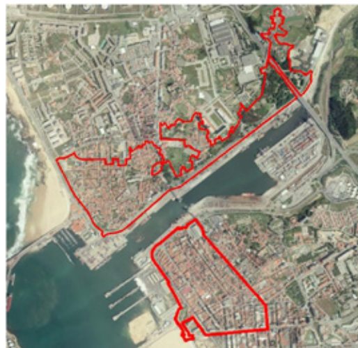
ARU de Matosinhos e ARU de Leça da Palmeira

Desta forma, entende a Quaternaire Portugal poder apoiar os investidores públicos e privados na preparação e negociação de candidaturas a essas fontes de financiamento.