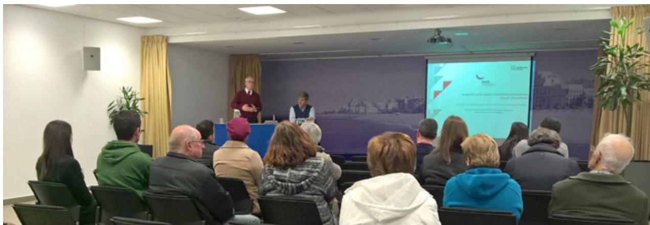
Apresentação de PARU e apoios à reabilitação urbana em Quarteira

Na Região Autónoma dos Açores, a Quaternaire Portugal está a trabalhar nos PIRUS da Madalena, Graciosa, Vila do Porto, Lajes do Pico e Corvo.