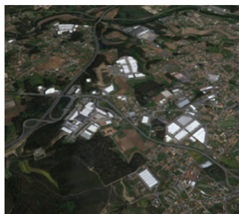
Santo Tirso – Áreas de Acolhimento Empresarial envolventes à Via do Trabalho

Começamos por destacar o grande envolvimento da Quaternaire Portugal no planeamento de redes e infraestruturas de acolhimento empresarial, cujo mapeamento está em curso nas regiões Norte e Centro do país.