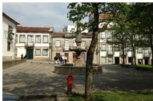
Praça em Vila Nova de Famalicão