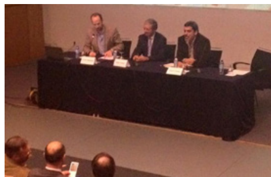
Braga, seminário sobre habitação pública